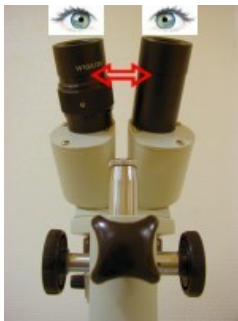
Ecartement inter pupillaire