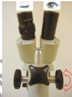
Mise au point avec œil droit