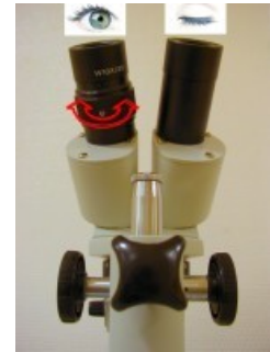
Correction dioptrique œil gauche